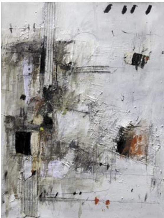
Ipotizzando un piccolo ricordo