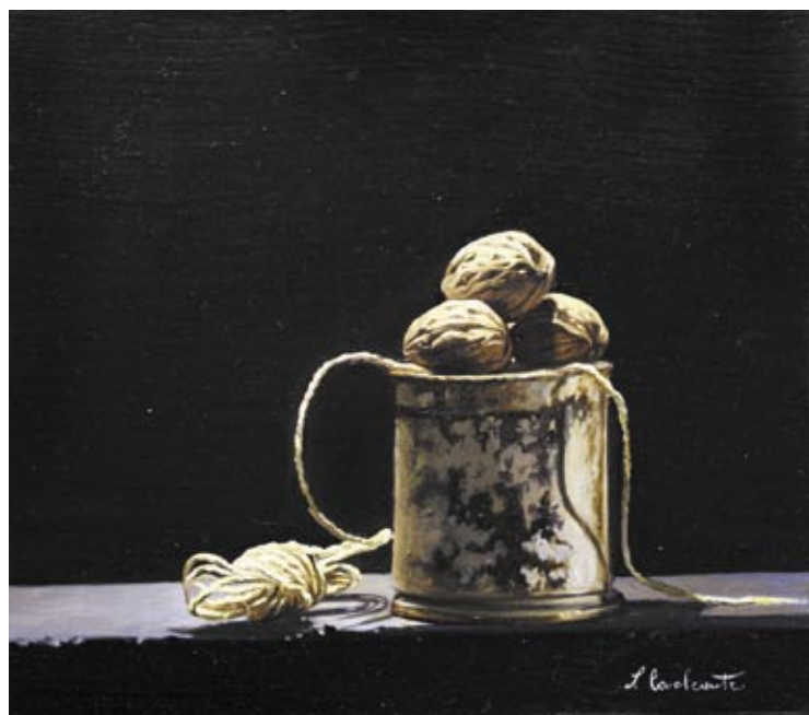
Stefania Cavalcante Cislano - Mi