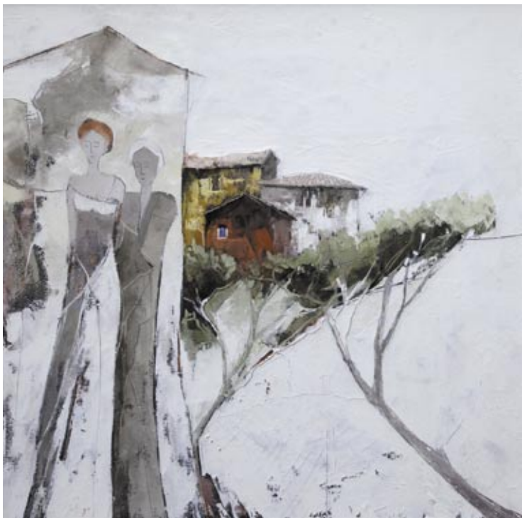
Elio Carnevali Pegognaga - Mn